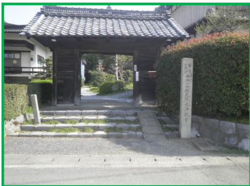
長源寺山門（施工前）