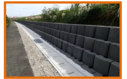
中間点から終点を望む