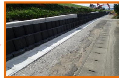
終点から起点を望む

現在、施工延長の7割程度が完了しており、約60mのブロック積と側溝の据付が残る程度となりました。10月も継続し施工してまいります。ブロック積と側溝の据付が完了したら、仮設道路の撤去、道路の舗装復旧に入っていきます。