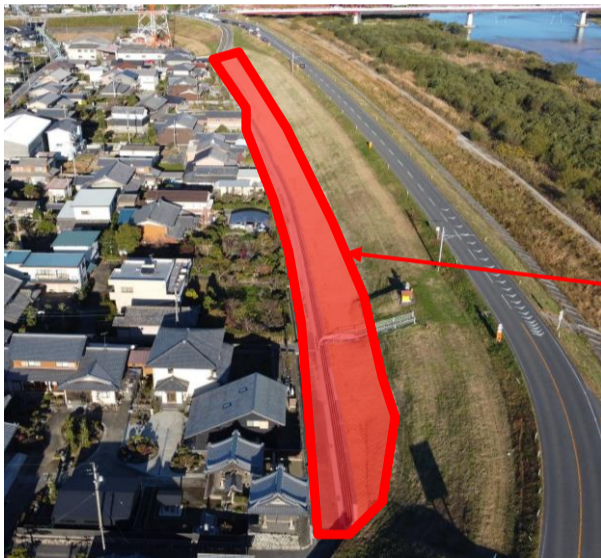
全ての工事が完了致しました (現場での清掃作業等は除く)