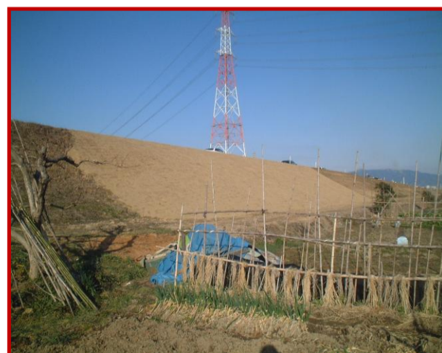
崩れた堤防の復旧補修

揖斐川支流、白石川での油流出によるオイルフェンス・油吸着マットによる応急作業 (揖斐川本流への油の流出を防止)