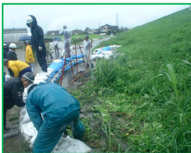
出水時での漏水対策

平成14年の台風による揖斐川の増水で、神戸町落合地内での「月の輪」工法による応急作業 (地元消防団と合同作業)