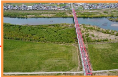
対岸の伐木除根箇所(着手前)

7月から対岸の伐木除根を行っています。河川内に大量に茂った樹木を伐採し、流水の支障を失くし安全に流下させる洪水対策を行う工事です。8月も大村地内のブロック積と対岸の伐採で同時に作業を進めていきます。