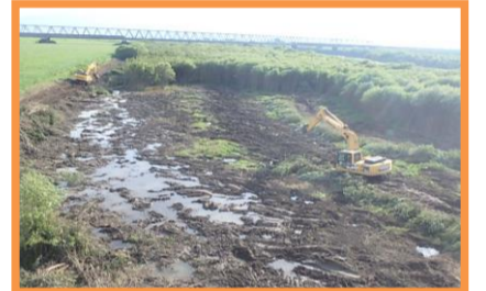
伐木除根作業状況