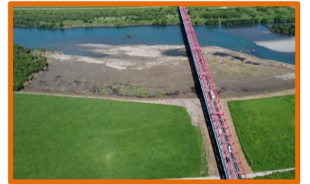
伐木除根作業完了