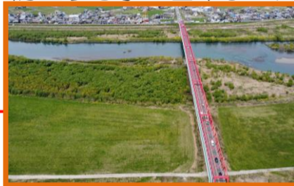
対岸の伐木除根箇所(着手前)

お盆の時期には、2週間近くもの長雨が続き揖斐川の増水もありましたが、昼夜巡視等を行い未然に被災を防止する事が出来ました。