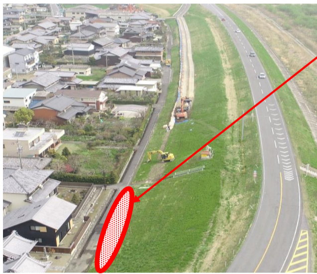
起点箇所から 施工をしています。